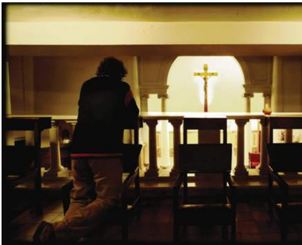
Una cella trasformata in cappella

I casi sono tanti. Da quando l'Eremo del silenzio ha aperto le sue porte, da qui sono già passate