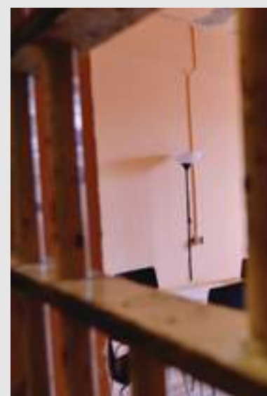
Per gli ospiti sedie, libri e tavolini

A disposizione di chi passa ci sono anche fogli e penne per scrivere i propri pensieri